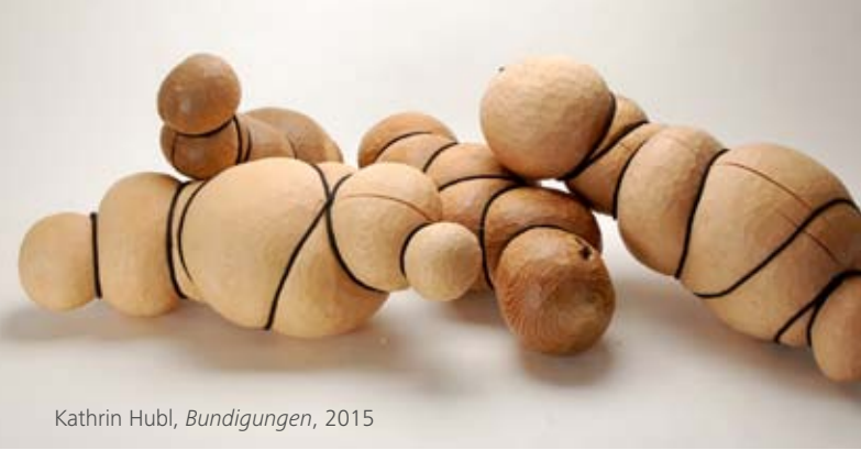
Kathrin Hubl, Bündigungen , 2015